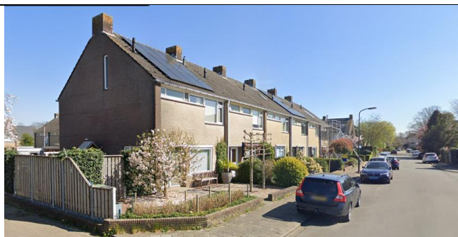
Schopenhauerstraat 107-109-111, Apeldoorn