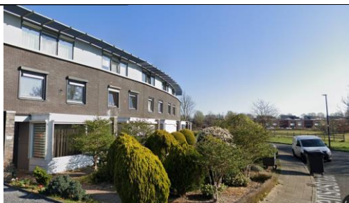
Lupineweg 102-104, Apeldoorn