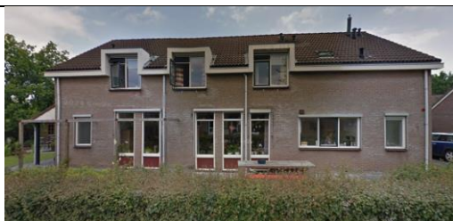
Abrikozenweg 30, Apeldoorn

Deze panden worden gekenmerkt door een hogere mate van zelfstandig wonen. Er is geen 24-uurs toezicht in de vorm van coördinatoren of bewaking. 2 coördinatoren beheren de panden op ambulante basis.