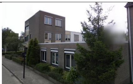
Fortunalaan 86, Apeldoorn