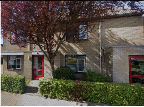
Vedelaarshoeve 30, Apeldoorn