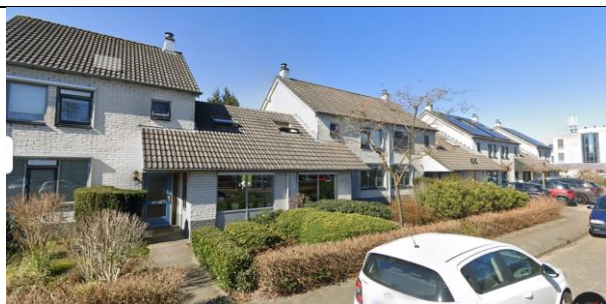
Pomonalaan 23-25, Apeldoorn